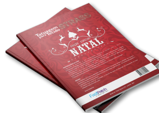
TATUAGEM PARA TECIDO STRASS | NATAL APSTRASSNATAL