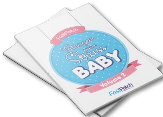
TATUAGEM PARA STRASS BABY 2 APBABY2