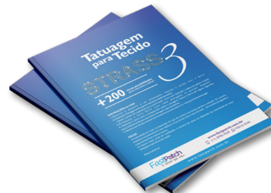
TATUAGEM PARA STRASS – VOL. 03 APSTRASS3