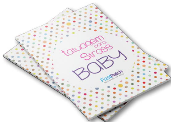
TATUAGEM PARA STRASS BABY APBABY