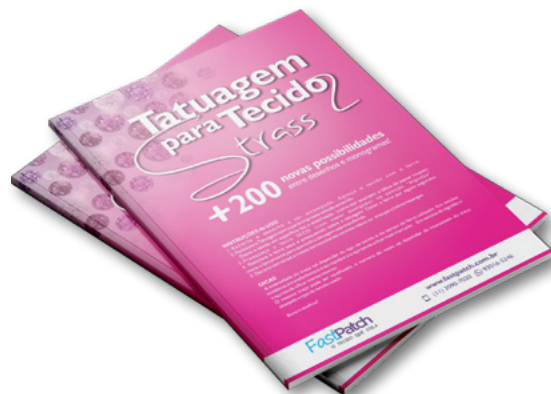
TATUAGEM PARA STRASS – VOL. 02 APSTRASS2